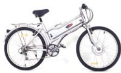
21 Speed Euro