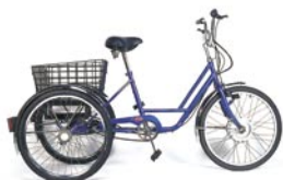
5 Speed Powatryke