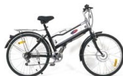
6 Speed Euro