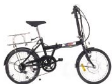
7 Speed Folding