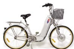
1 & 6 Speed Shopper