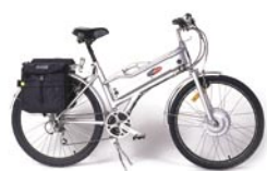
24 Speed Commuter

Independent test review - A to B magazine Powabyke beat the competition 'hands down' "it's fast & goes further"